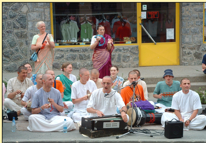
Harinam u Križevcima