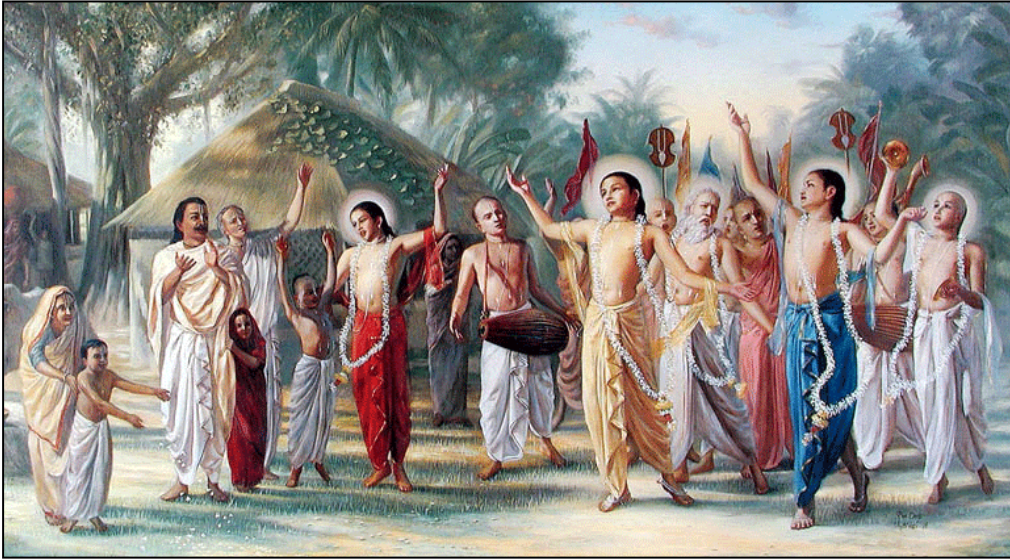
Gospodin Caitanya sa svojim pratiocima

predanog služenja Gospodina sa ljubavlju, iako se može osloboditi posljedica najgrješnijih djela. S druge strane, ako samo jednom izgovori Gospodinovo sveto ime, ne samo da se odmah oslobađa posljedica najvećih grijehova već se i