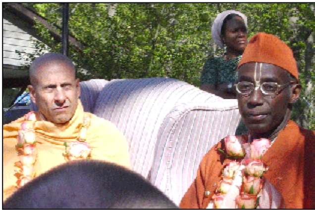
Radhanatha Swami i Bhakti Tirtha Swami

morao žrtvovati razvijanje izvanjskih odlika sadhua, već mislim da se više radilo o načinima na koji sam morao djelovati da uđem kao igla, a izađem kao slon. Na kraju, upravo mi je ta služba - kreativni sankirtan - i omogućila da neprekidno budem u Srila