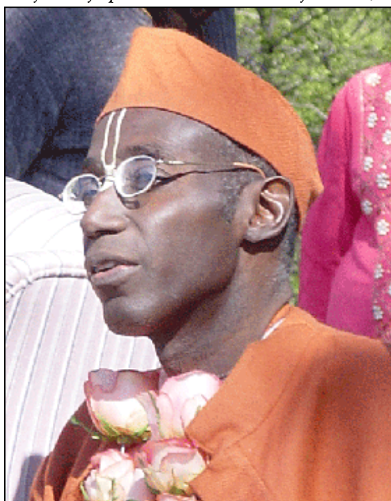
Gita Nagari 08.05.2005

Prijevod je preuzet s www.vvz-rijeka.net , a slika s www.btswami.com