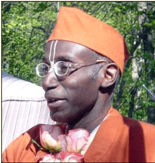
HH Bhakti Tirtha Swami

skim događajima na godišnjim izletima u Gita-nagari. Dok je govorio Gurudeva je pokazivao nevjerovatnu izdržljivost i snagu, bio je tako sretan okružen mnogobrojnim bhaktama koji su došli iz cijelog svijeta kako bi bili s njim.