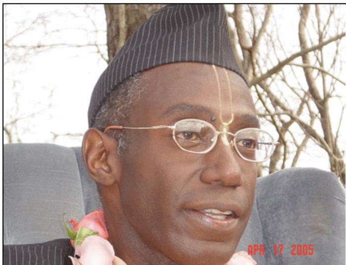
Gita Nagari 17.04.2005

kao i činjenica da je moj život bio moja poruka - taj ponešto jedinstven način na koji sam služio Srila Prabhupadina misiju.