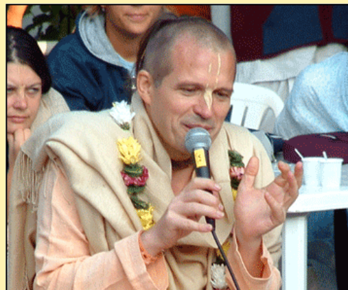
HH Sacinandana Swami