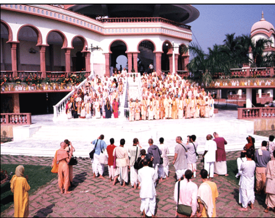
Međunarodni pokret za svjesnost Krišne

Nadalje, sadašnje popularno korištenje termina "Hinduizam" ne odgovara njegovom izvornom značenju. Riječ "Hindu" je Perzijski krivo izgovorena riječ "Sindhu", što je sanskrito ime rijeke Indus. Za mogulske osvajače koji su u Indiju ušli prelazeći Indus bilo je prirodno da se na osvojeni teritorij pozivaju kao na Zemlju rijeke Indus ili Hindustan. Pravilno govoreći "Hindu" je stoga stanovnik Hindustana neovisno od svoje religije. Međutim, Britanci su koristili riječ "Hindu" za Indijce koji nisu bili Muslimani, Budisti, Sikhi, Jinisti ili članovi drugih religijskih skupina za koje su Britanci imali nazive. "Hindu" je korišteno kao kratica za opis doslovno tisuća prilično različitih religijskih i kulturnih uzoraka preko beskrajnog prostora Indijskog potkontinenta.