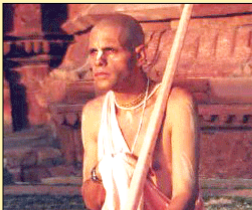
HH Paramgati Swami