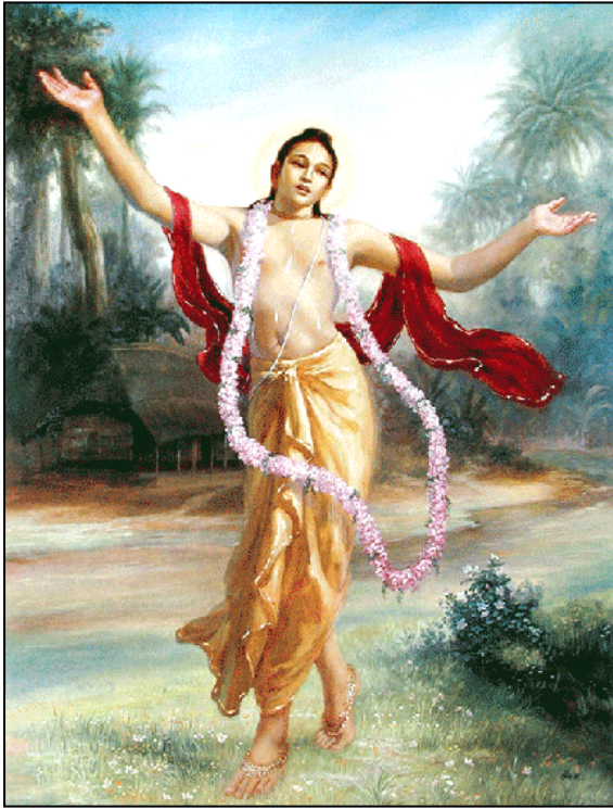
Sri Caitanya Mahaprabhu

Gospodin Šri Caitanya Mahaprabhu, veliki apostol ljubavi prema Bogu i začetnik skupnog pjevanja Gospodinovog svetog imena, pojavio se u Šridhami Mayapuri, u četvrti grada Navadvipe u Bengalu, na večer Phalguni Purnime, 1407. godine Šakabde (u veljači, 1486. godine po kršćanskom kalendaru).