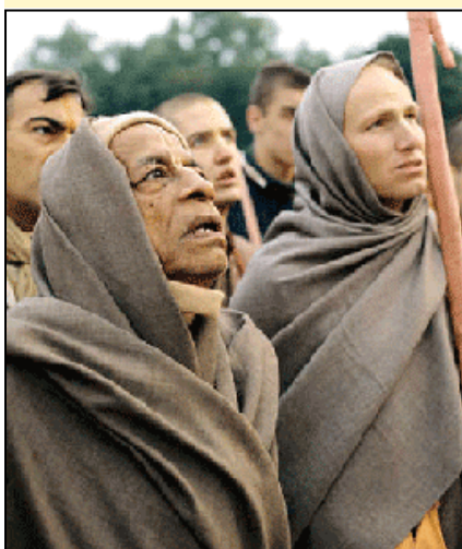
A.C. Bhaktivedanta Swami Prabhupada

Sri Srimad A.C Bhaktivedanta Swami Prabhupada, Nektarska uputstva