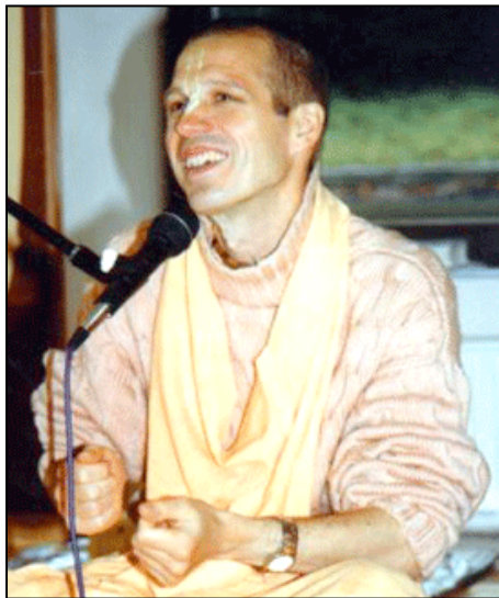
HH Sacinandana Swami

Nektarski ocean Svetog Imena Šacinandana Swami