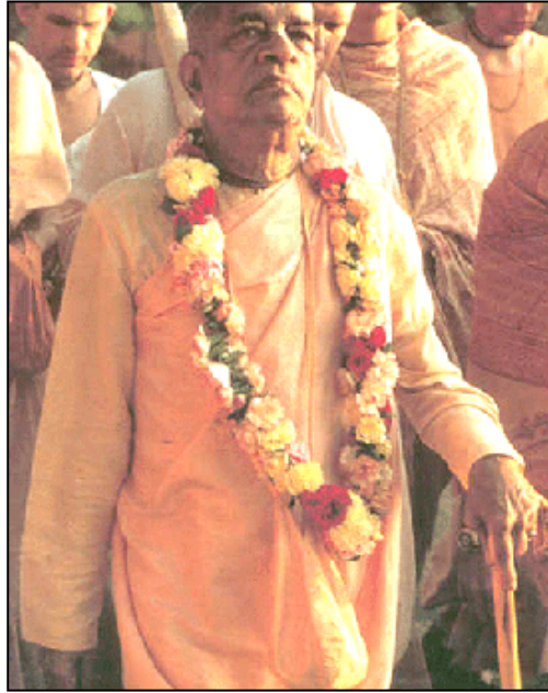
A.C. Bhaktivedanta Swami Prabhupada

Srila Prabhupada: Time što Krišna kaže je dokazano.