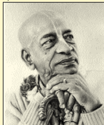
Osnivač - Acarya: Njegova Božanska Milost A.C.

Međunarodno društvo za svjesnost Krišne - ISKCON